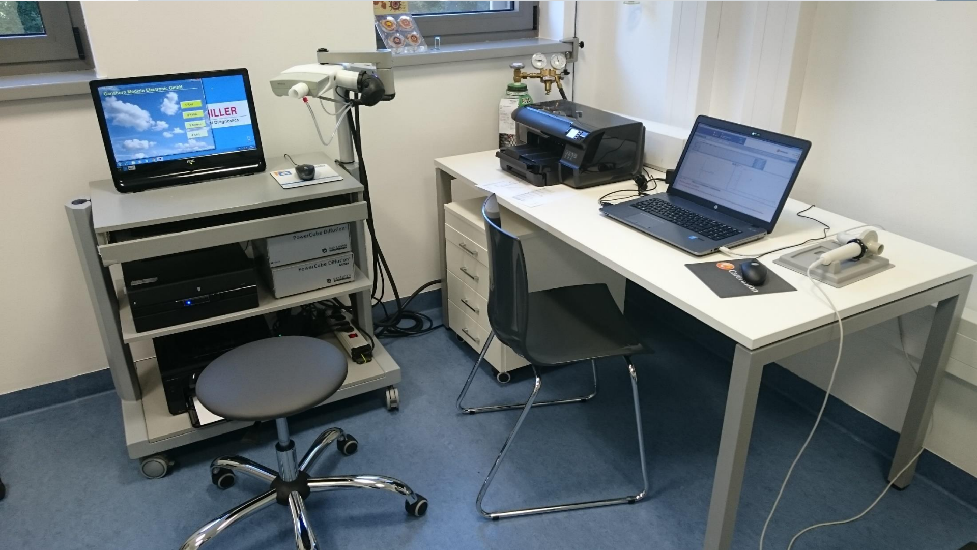
Spirometrija, Impulsna oscilometrija